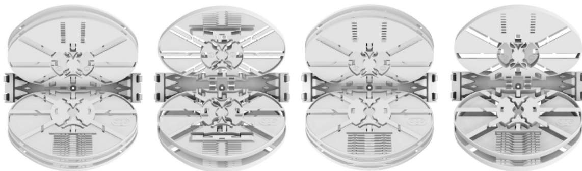
Beispiele für Patchmuffe / Example for patch closure: