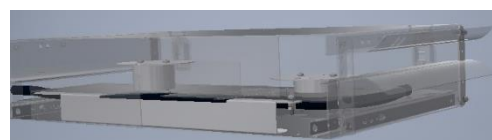
Ansicht von hinten / view from behind