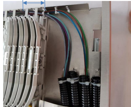
unterstes Fasermanagement / lowest Fiber Management